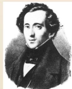
メンデルスゾーン