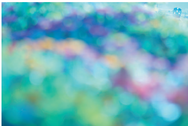
由利高原鉄道黒沢駅