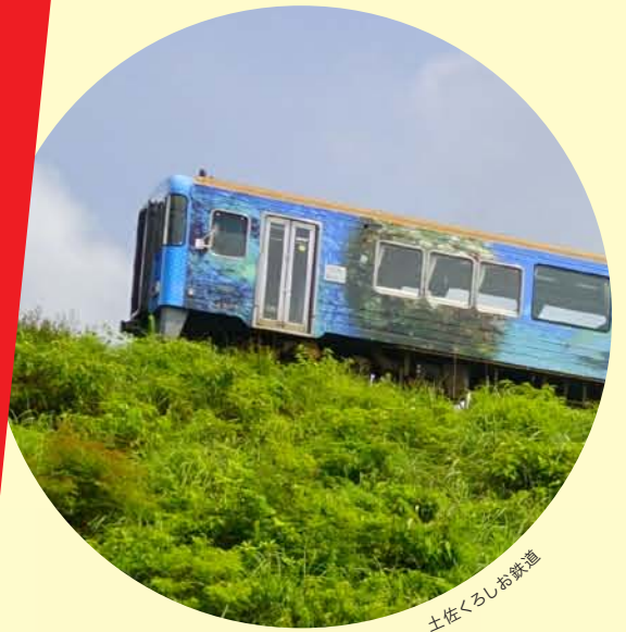
土佐くろしお鉄道